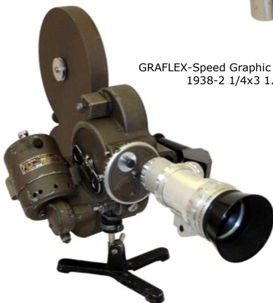
BELL & HOWELL-Eymo-1950-16mm