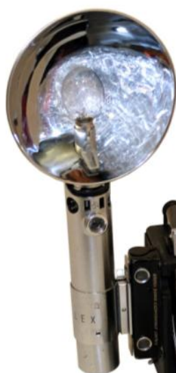
GRAFLEX-Speed Graphic Miniature- 1938-2 1/4x3 1.4