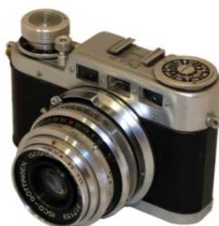
DIAX CAMER WORK-Diax 1a- 1952-35mm