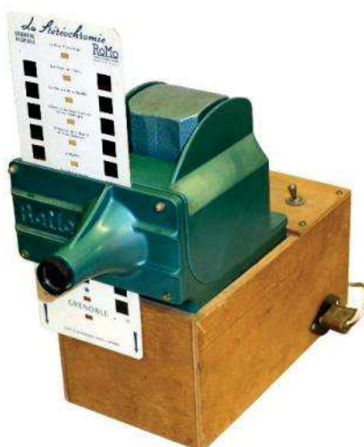
ROMO, Projecteur-1950-Vues stéréo carton