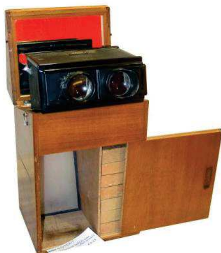
GAUMONT, visionneuse Bakélite avec coffret bois-1920-6x13cm