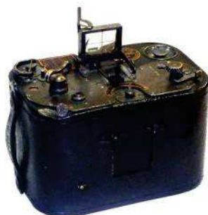
GRAFLEX, Graphic 0-1905