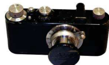
LEITZ, Leica 1c-1930-24x36mm

ET AUSSI : ALSAPHOT Cady, 6x6cm- KODAK Retinette, 1941, 24x36mm- KODAK 35 , 1940, 24x36mm- ROCHE Rox, 1948, 6x9cm- ROYER Royflex, 1953, 6x6cm- VAVASSEUR Box, 1900, 6x9cm- VOIGTLAN- DER Bessa, 1930, 6x9cm- WELTA Wetix, 1939, 24x36mm- ZEISS IKON Ikonta 522.24, 1948, 24x36mm.