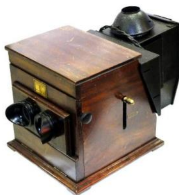
PLANOX Universel avec lanterne de projection 1931