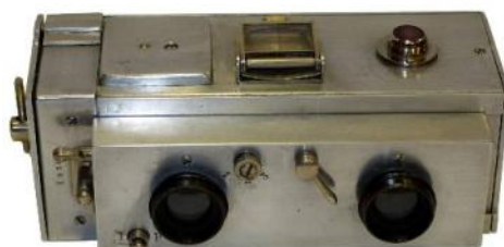
HANAU Le Marsoin 45 x 107 mm, 1905