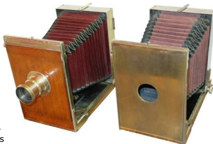
N. CONTI , Compagnie Française de Photogra- phie, Chambre Tropical 13 x 18 cm laiton nickelé , 1886 A gauche modèle de série, à droite prototype