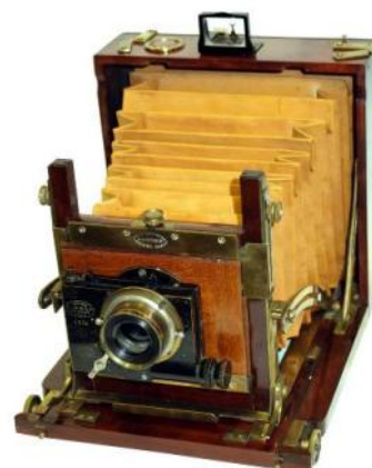
GAUMONT , Chambre Block système 9 x13 cm, 1920