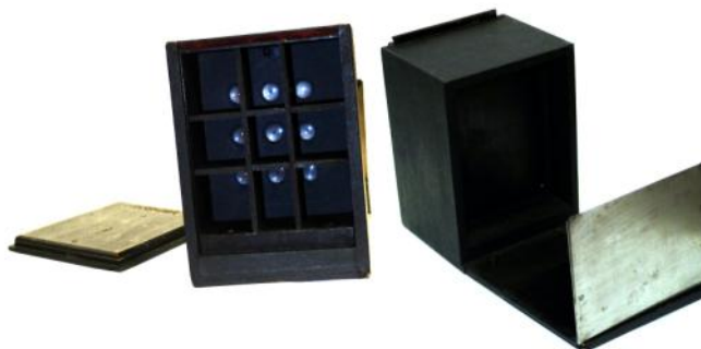
HOUGHTON Holborn Stamp Camera 9 x12 cm, 1901