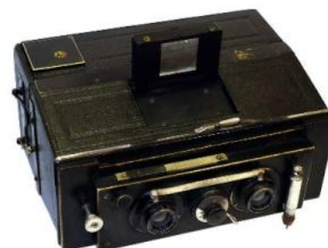
JARRET , Stéréo Suffren n°2, 6 x 13 cm, 1904