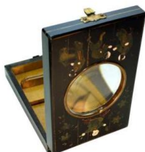
GRAPHOSCOPE , mono- cle, fin 19è—décor chinois