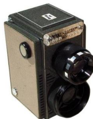
FUJIMOTO , Flexslide 35, projecteur forme 6x6, 1966/1970